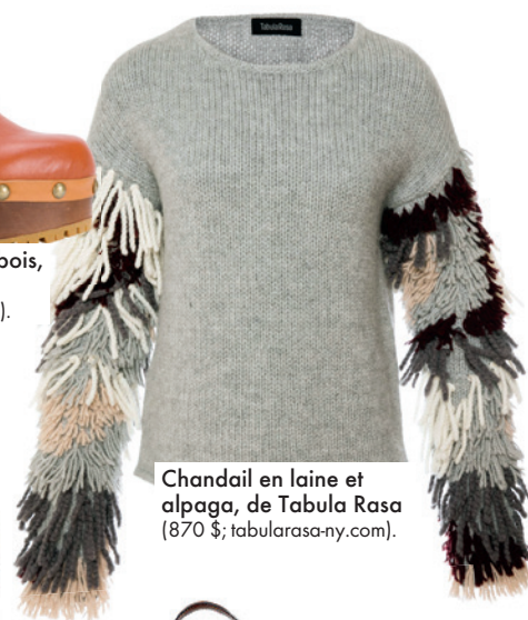
Chandail en laine et alpaga, de Tabula Rasa (870 $; tabularasa-ny.com).