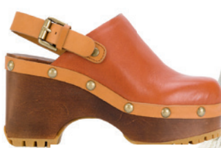
Sabots en cuir et bois, de See by Chloé (658 $; farfetch.com).

On s'emmitoufle dans des tricotés et des pantalons chauds à la touche artsy , histoire de faire de cette escapade dans la nature un séjour à la fois pratique et stylé tout en ayant un look digne d'une déesse sortie d'un conte d'automne.