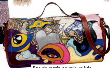
Sac de marin en cuir, suède et python, de Marc Jacobs (5899 $; bloomingdales.com).