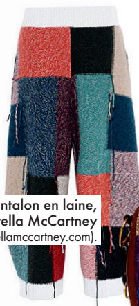
Pantalon en laine, de Stella McCartney (1170 $; stellamccartney.com).