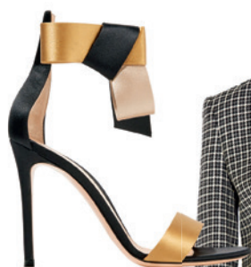
Sandales en satin, de Gianvito Rossi (1250 $; net-a-porter.com).

Un séjour en amoureux en plein centre-ville appelle une touche de lingerie en dentelle à glisser (et laisser discrètement entrevoir?) sous une veste de tailleur structurée. Ou comment saupoudrer un ensemble chic et moderne d'un soupçon de romantisme, à l'image du Mount Stephen.