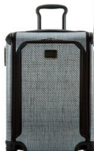
Valise en Tegra-Lite, de Tumi (865 $; nordstrom.com).