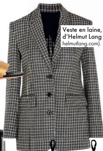
Veste en laine, d'Helmut Lang (1120 $; helmutlang.com).