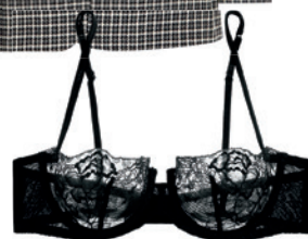
Soutien-gorge balconnet en dentelle, de La Perla (195 $; shopbop.com).